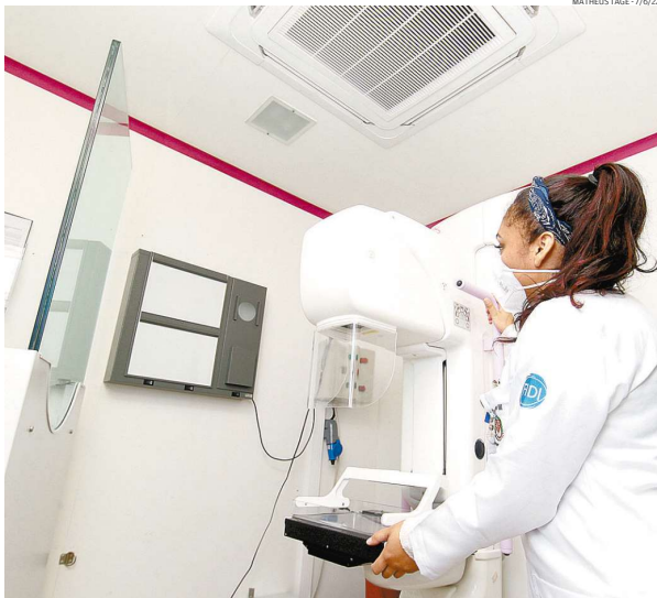
Carreta da Mamografia, organizada pela Secretaria Estadual da Saúde, passará por Mongaguá e Cubatão

Os exames da carreta são realizados de segunda a sexta-feira, das 8 às 17 horas, e, aos sábados, das 8 às 12 horas, exceto aos feriados. Essas unidades podem atender até 50 pacientes por dia nos dias úteis e, aos